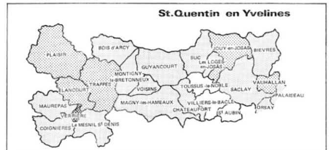
1 Deit Pierre. Cinq villes nouvelles dans la Région parisienne. In: Economie et statistique, n°50, Novembre 1973. pp. 61-66

Le premier périmètre d'étude pour la ville nouvelle de Saint-Quentin-en-Yvelines couvrait un territoire allant de Plaisir jusqu'à Massy, englobant le plateau de Saclay et la vallée de Chevreuse 6 , comprenant jusqu'à 30 communes.