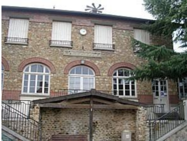
Partie centrale (mairie) tout en pierre meulière